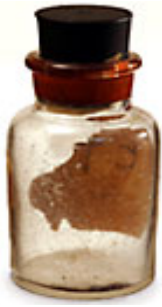
福竜丸が浴びた死の灰