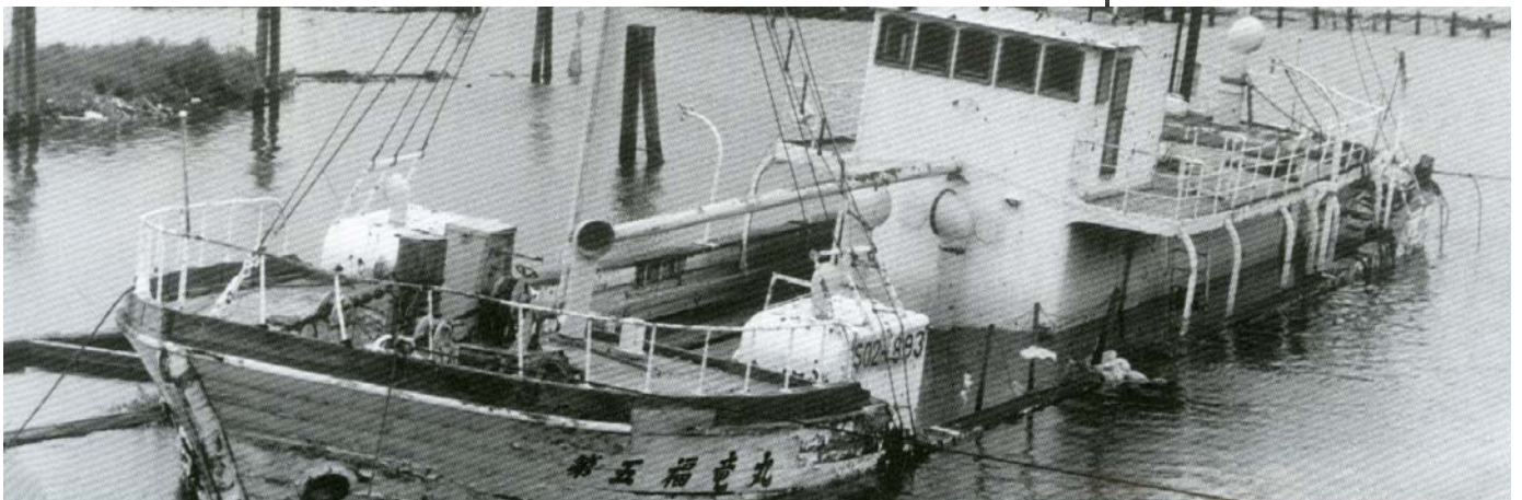
廃船の危機にあった福竜丸