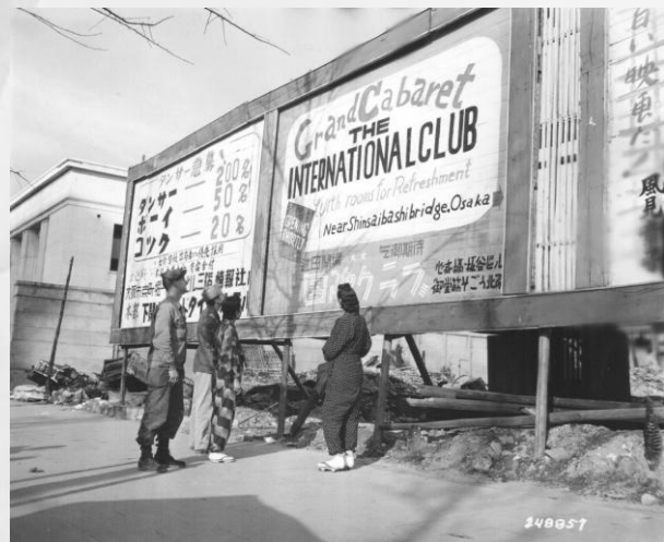
心斎橋にできたキャバレーの開店広告 1945(昭和20)年11月15日