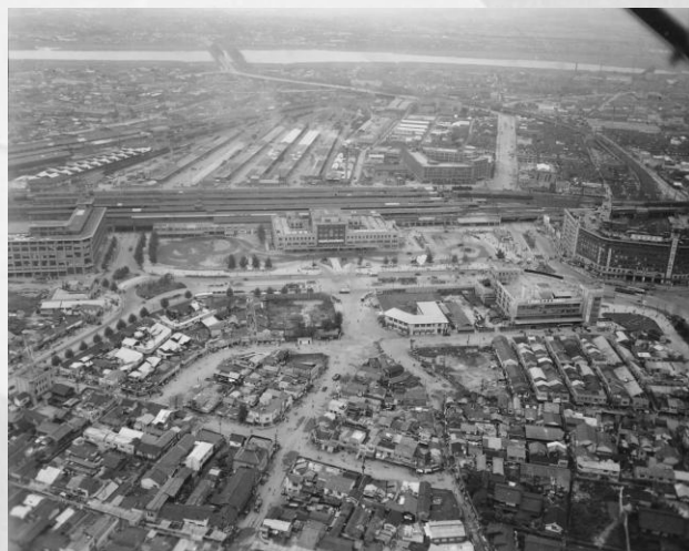
大阪駅周辺 1949(昭和24)年10月21日

今日まで残された貴重な記録資料を通して、アメリカの視点から、戦中・戦後の大阪を振り返ります。