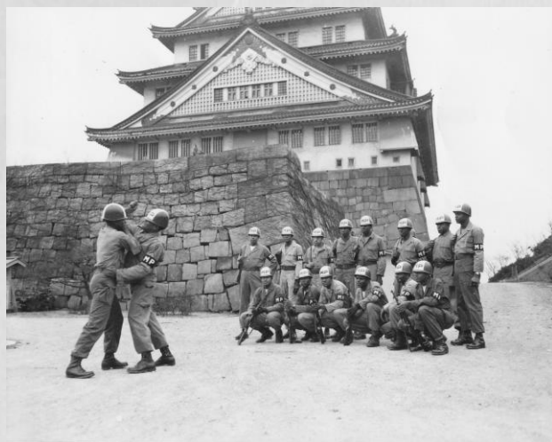
大阪城前で、柔道の指導を受ける米軍憲兵の隊員たち 1951(昭和26)年2月16日